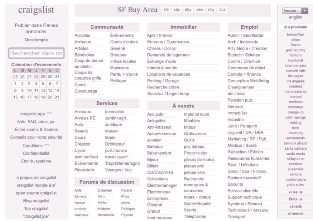
Craigslist.org, capture d'écran du 21 mai 2005 et du 21 mai 2020. Le site Craigslist n'a quasiment pas changé dans sa conception entre 2005 et 2020 et qu'il a gardé en très grande partie son esthétique brute et par défaut malgré son succès de très grande ampleur.